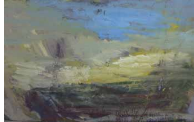
„Kolijevka” ulje na platnu, 2011 50 x 80 cm

Jelena Delević Rođena u Podgorici 1975. godine. Diplomirala na FLU, Cetinje. Diplomirala na Ecole Superieure d'Art de Cornouaille - Quimper, Francuska.